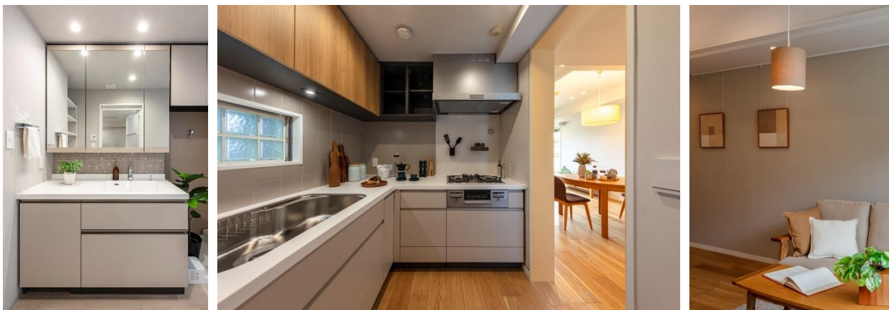
洗面台の鏡の下に廃材利用のタイルを使用／キッチン壁面に再生材利用のタイルを使用／コーヒー染めのペンダント照明