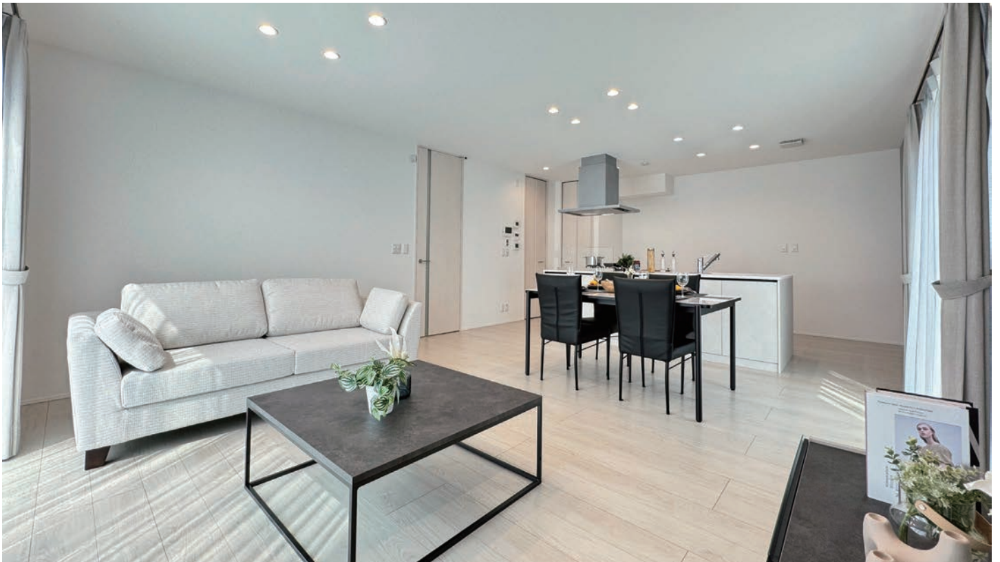
4号地内観写真(2024年3月撮影)