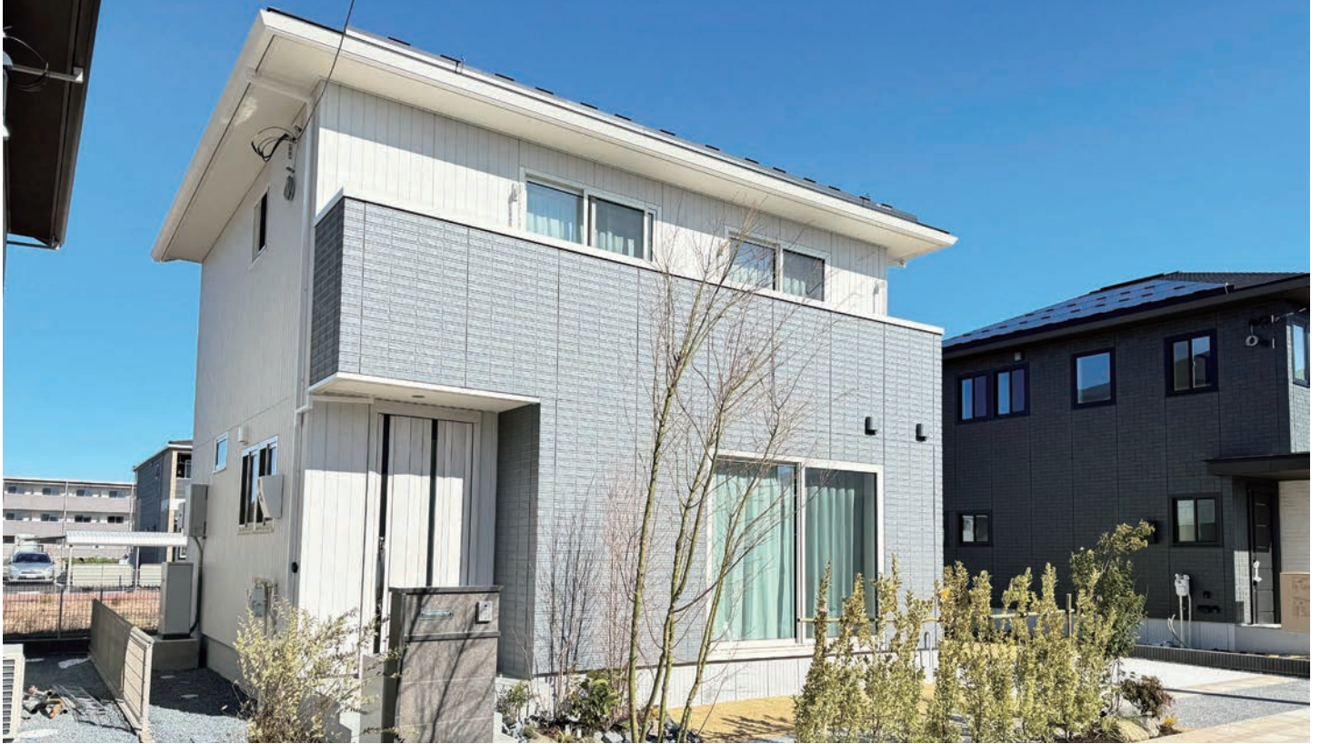
4号地外観写真(2024年2月撮影)

■敷地面積 / 182.79m 2 (約55.29坪) ■延床面積 / 102.85m 2 (約31.11坪) ■1F床面積 / 53.99m 2 (約16.33坪) ■2F床面積 / 48.86m 2 (約14.78坪)