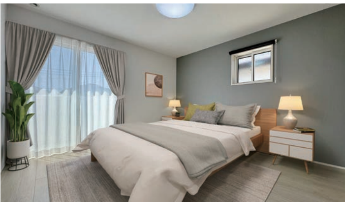
4号地内観写真(2024年3月撮影)

家具、家電、備品等は価格に含まれません。(主寝室写真内の家具・家電・備品等はCG加工により配置例を示したものです。)