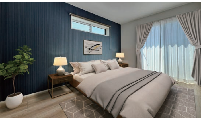
5号地内観写真(2024年3月撮影)