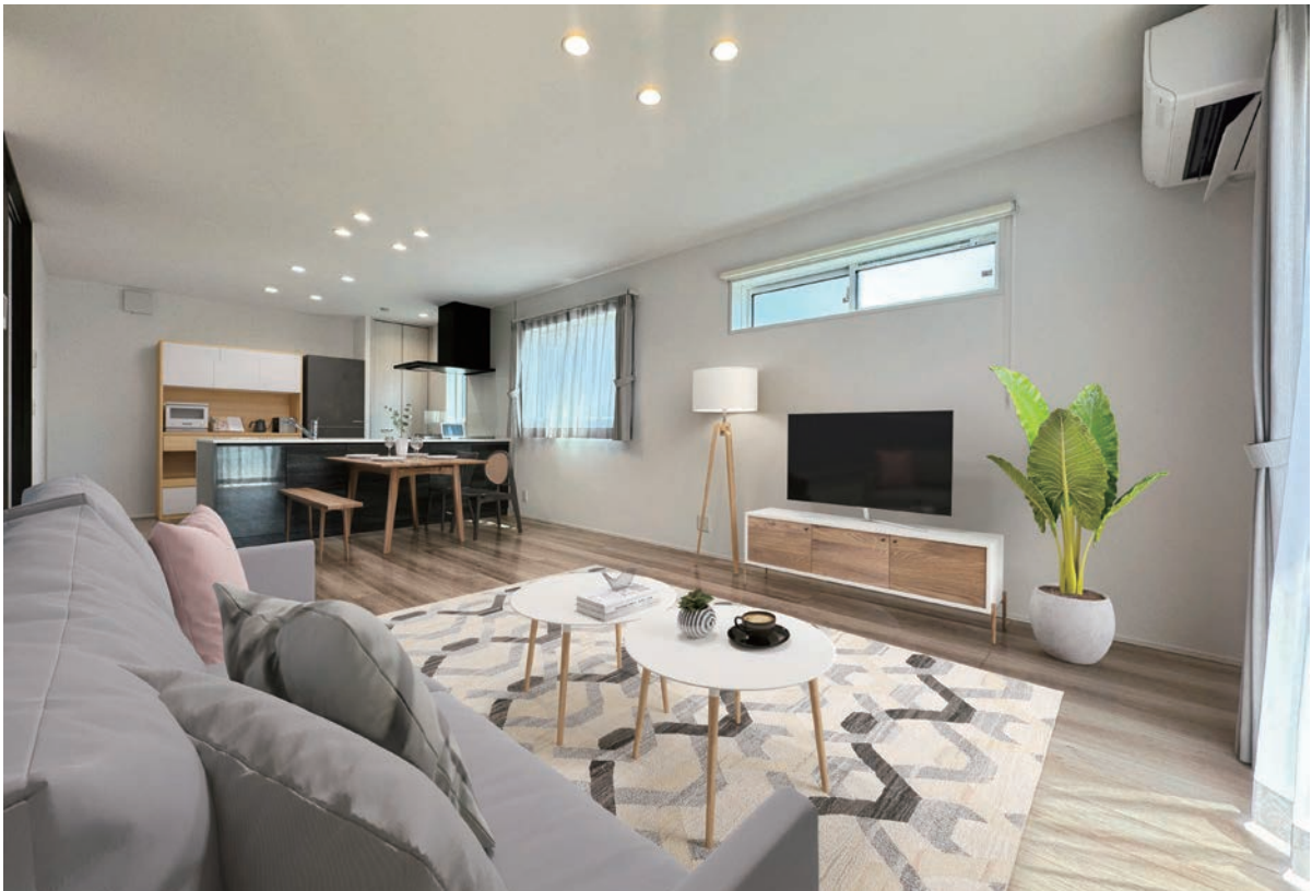
5号地内観写真(2024年3月撮影)

※写真内の家具・家電・備品等はCG加工により配置例を示したもので販売価格に含まれません。