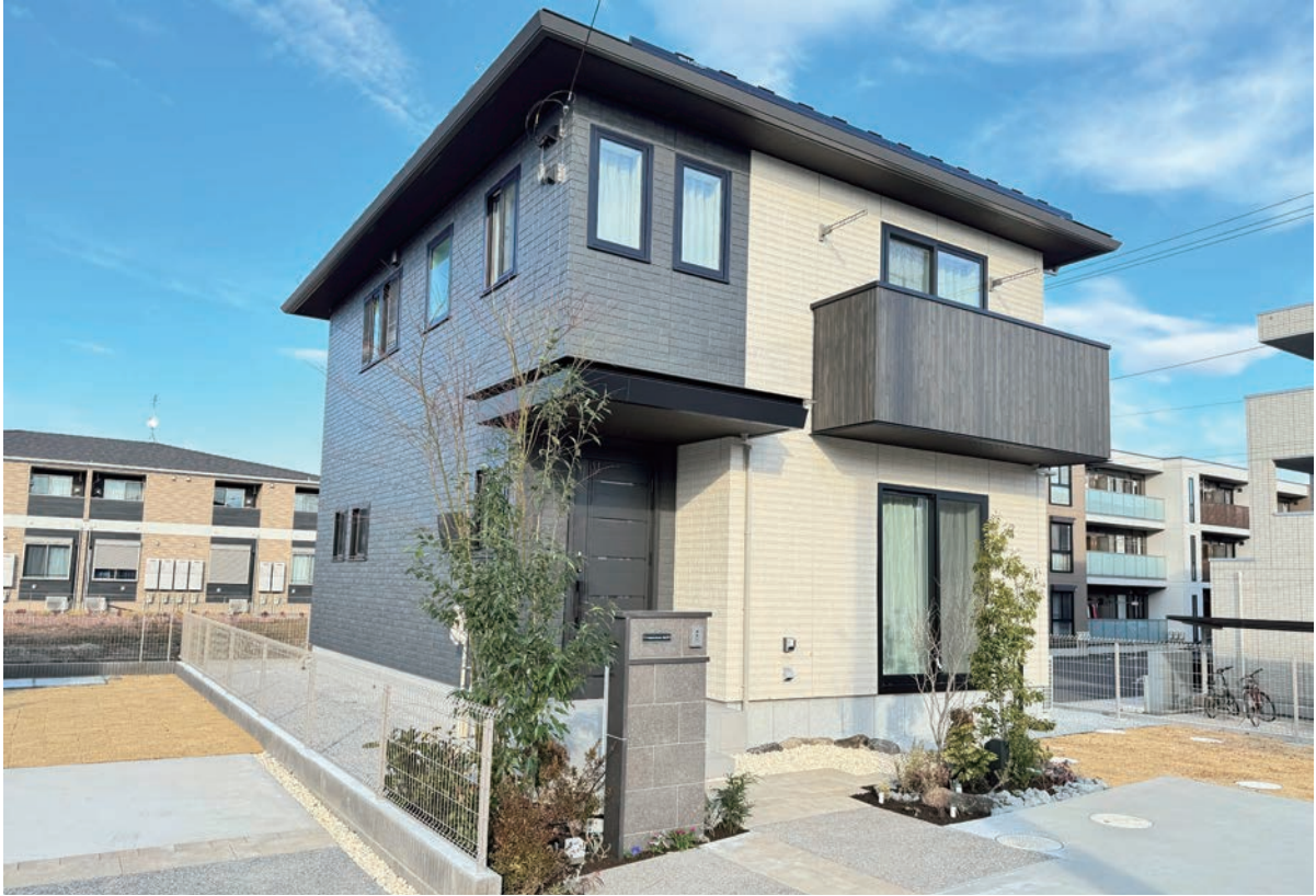
5号地外観写真(2024年2月撮影)

■敷地面積 / 185.00㎡(約55.96坪) ■延床面積 / 107.98㎡(約32.66坪) ■1F床面積 / 53.16㎡(約16.08坪) ■2F床面積 / 54.82㎡(約16.58坪)