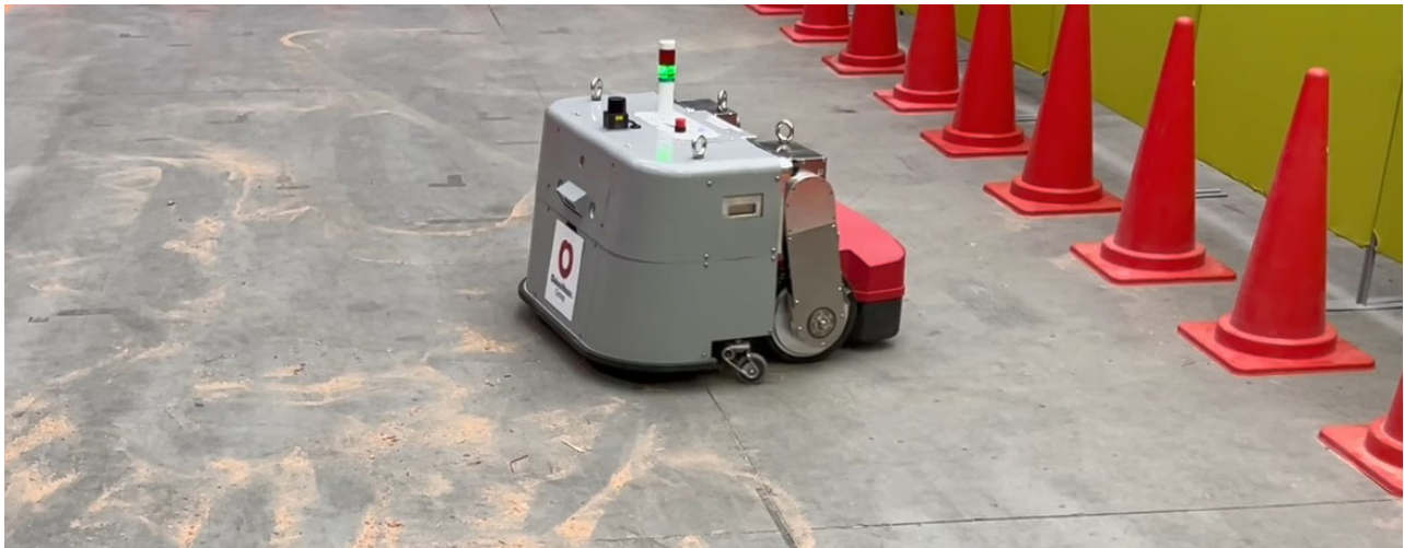
【自走掃除ロボットによる清掃のようす】